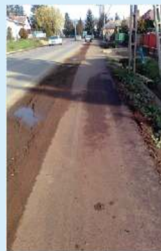
Felújított kerékpár út