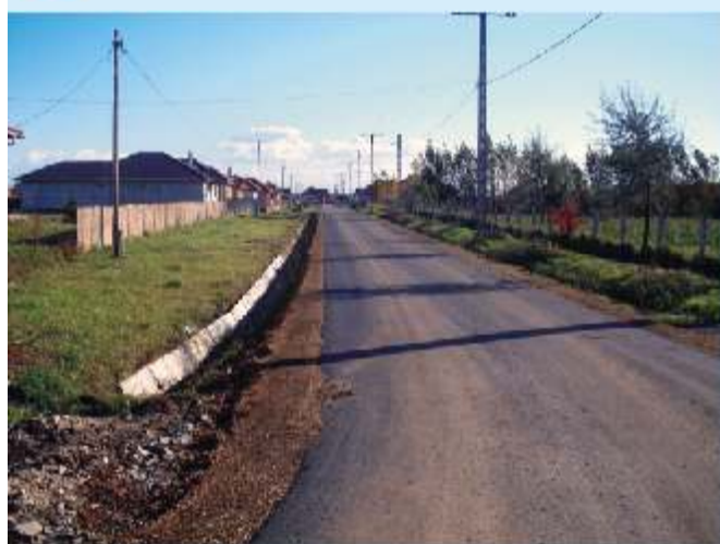
Antall József utca