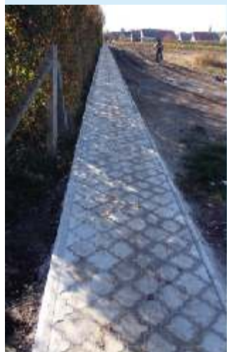
Az Antall József és Szent István utcák közti járda, mely saját gyártású burkolókövekkel készült