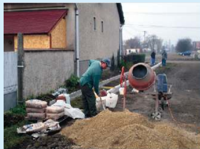
Készül a járda a Szent István és Tűzoltó út között