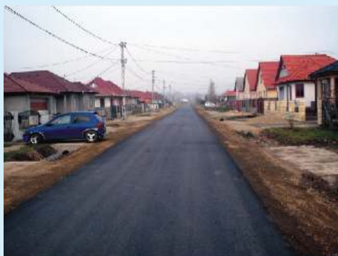
A Szent István út új aszfalt burkolata